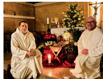
Gemeinschaftstage der Brüder von Gut Aich - besinnlich und lustig.