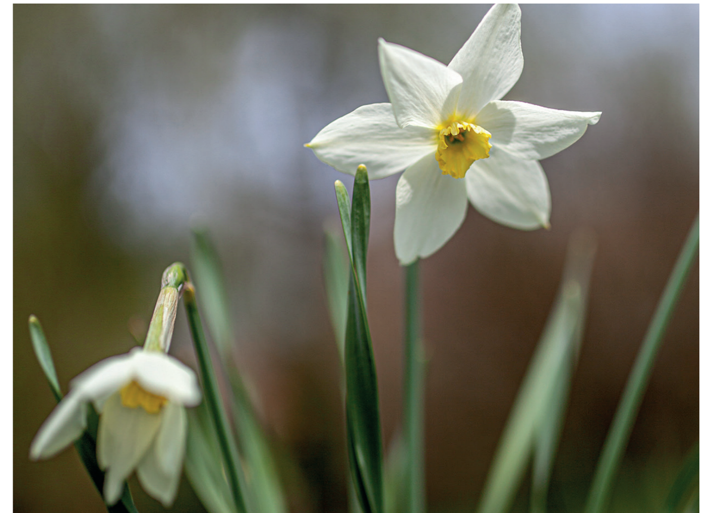
Diese Narzisse, auch Osterglocke genannt, erblüht jedes Jahr im Garten vor der Klosterpforte.

„Großmachtdenken und -handeln“) und der politischen Radikalisierung auch in unseren Breiten geht. Was gibt uns Halt? Wo finden wir Orientierung? „Fahren auf Sicht“ ist angesagt. Vor allem ist es eine Zeit, um zu lernen. Sich dieser Tatsache bewusst zu sein, gibt Halt und bringt uns in eine Haltung des Lernens. Da gehört wesentlich dazu, dass ich auch Verunsicherung spüre – mich jedoch auf Überraschungen, seien sie jetzt positive oder negative, einstelle. In Lernprozessen – ob in der Schule oder auch im lebenslangen Lernen – übe ich mich. Und ich lerne zu unterscheiden. >>>