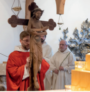
LEIDEN UND STERBEN